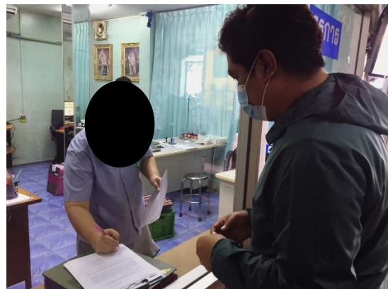
รูปที่ 3 ตัวอย่างภาพการเก็บตัวอย่างแบบสอบถามของผู้นำชุมชนและหน่วยงาน วันที่ 15-22 ธันวาคม พ.ศ. 2564 โครงการโรงผลิตไฟฟ้า ของบริษัท ทีพีโอ โพลีน เพาเวอร์ จำกัด (มหาชน)