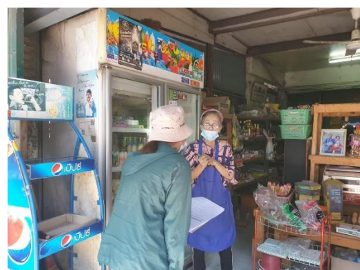
รูปที่ 2 ตัวอย่างภาพการเก็บตัวอย่างแบบสอบถามของประชาชน วันที่ 15-22 ธันวาคม พ.ศ. 2564 โครงการโรงผลิตไฟฟ้า ของบริษัท ทีพีโอ โพลีน เพาเวอร์ จำกัด (มหาชน)